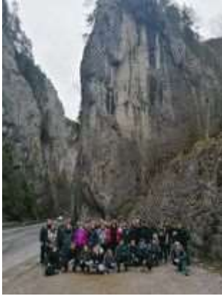
3. állomás: Bucsin tető